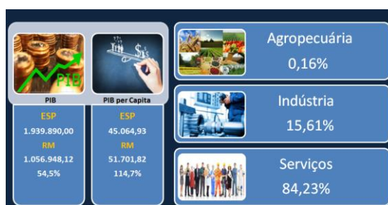
PIB / PIB per Capita / Valor Adicionado

A atividade agrícola tem se dado, em determinadas áreas, apenas na produção de hortifrutigranjeiros. É interessante notar que não tendo o mesmo peso dos demais setores, a RMSP responde fortemente no total da receita líquida da agroindústria estadual, uma vez que parte significativa dela procurou manter-se próxima do grande mercado consumidor ou, ainda, sua operação e gerenciamento buscou, na área metropolitana, a melhor logística para alcançar os mercados interno e externo.